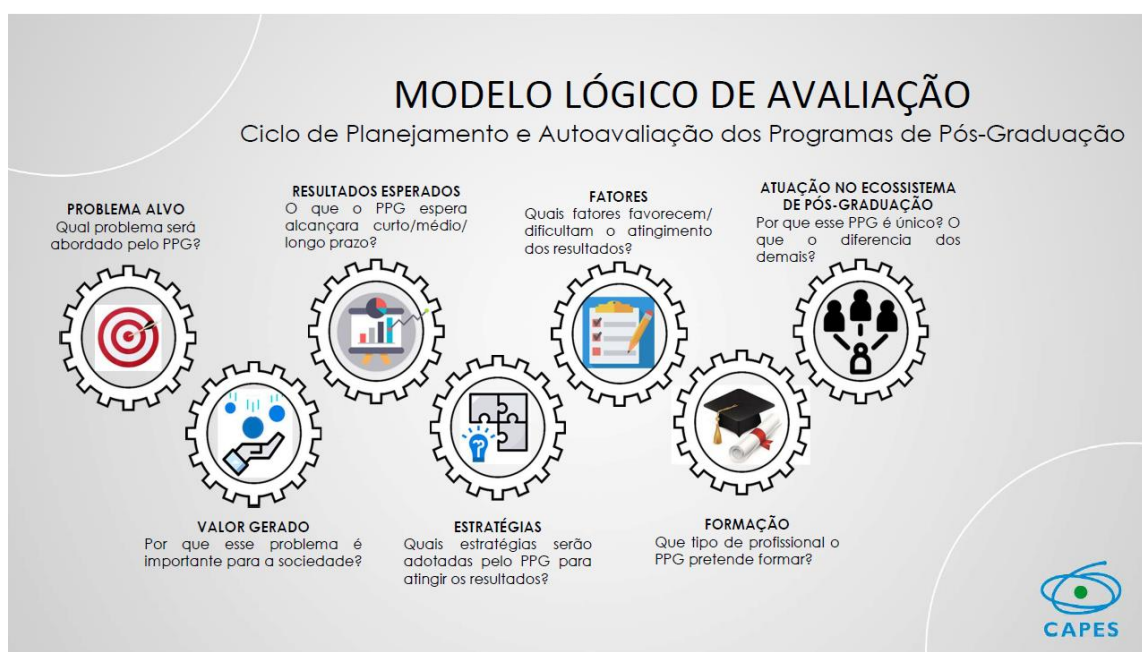
Figura 2 - Planejamento e autoavaliação dos Programas de Pós-Graduação.

O Programa deve analisar e planejar o seu desenvolvimento de forma que as ações e metas sejam claras a todos os participantes, para isso a discussão coletiva desse projeto deve acontecer para que todos sejam corresponsáveis pela qualidade e melhoria do Programa. Há a necessidade que todos devam trabalhar para que o Programa continue a evoluir como um ecossistema (figura 2), onde os estudantes, docentes, técnicos e egressos, participem como elementos do desenvolvimento do Programa e da instituição.