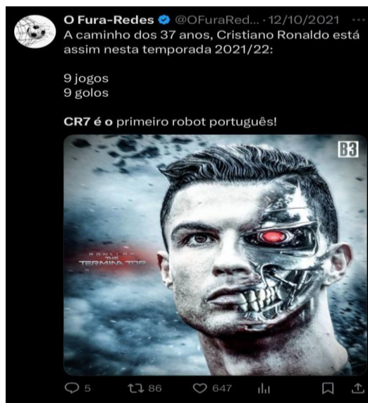
Figura 4 - Cristiano Ronaldo, o primeiro robô português.

é normalizado e muitas vezes um resultado esperado, uma expectativa resultadista do torcedor para com o atleta, como vemos em discursos sendo vinculados no X, como demonstra a figura 4.