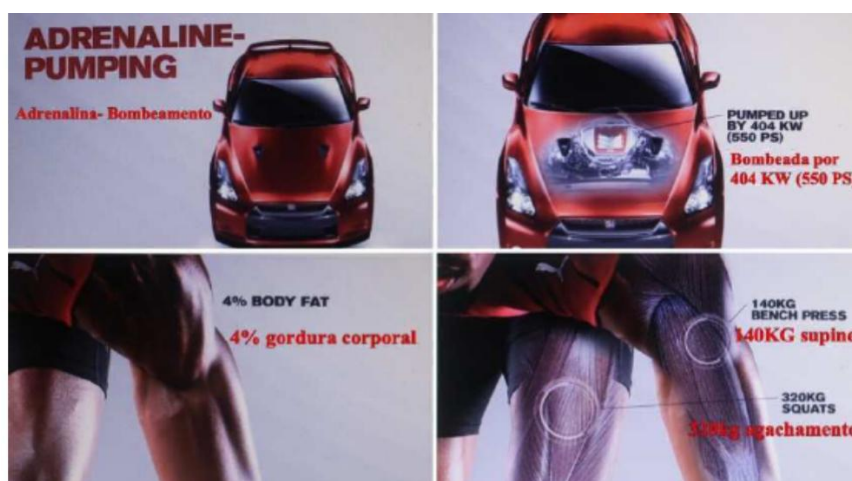
Figura 2 - Mecânica-Anatomia/combustão-movimento

Ao interpretarmos a peça publicitária da Nissan, que faz parte de um filme publicitário, com duração de 1 minuto e 29 segundos, da “Nissan GT- R” como parte da campanha publicitária denominada “ What is... ”, por exemplo, como podemos constatar na figura 2, logo abaixo: