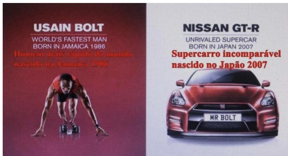
Figura 3 - Usain Bolt vs Nissan GT-R

Notamos o recorrente o uso estratégico da metáfora como uma forma de conectar aos elementos discursivos. Outros aspectos gramaticais, podemos observar na figura 3, a seguir.