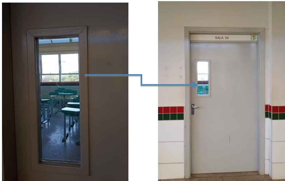
Figura 4 – Portas das Salas