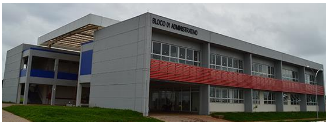
Figura 2 – Prédio Padrão Bloco 01 Administrativo