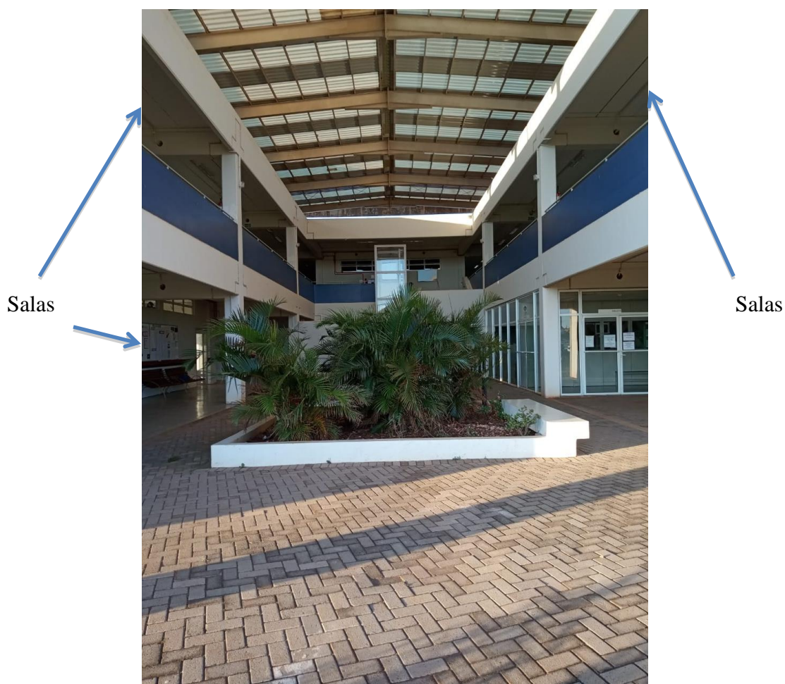
Figura 3 – Vista frontal do Bloco 01 Administrativo