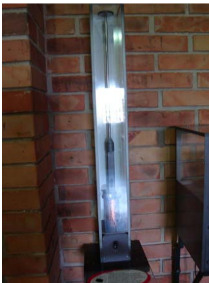
Figura 1 – Anel de Thompson

movimentação do anel. Através da lei de Lenz pode-se explicar a força de repulsão que surge, responsável por fazer o anel saltar.