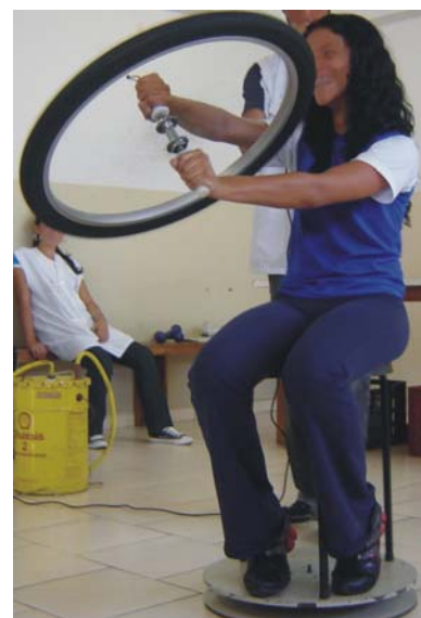
Figura 6 – Cadeira giratória

- Cadeira giratória (e mais uma roda de bicicleta) (figura 6): Trata-se de um experimento relacionado à conservação da quantidade de momento angular. Quando o visitante impulsiona a roda da bicicleta, esta adquire uma velocidade angular e, conseqüentemente, um momento angular. Para garantir a conservação da quantidade de momento angular no sistema, a cadeira giratória gira no sentido oposto ao da roda. Ao promover a virada da roda em 90^\circ (de cabeça para baixo), o momento angular da roda é então dirigido para baixo e, por consequência, a cadeira diminui a velocidade, para e começa a girar em sentido oposto.