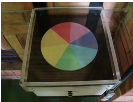
Figura 2 – Disco de Newton

- Disco de Newton (figura 2): trata-se de um disco pintado com as mesmas cores que compõem o espectro de luz branca. Quando aumenta a velocidade do disco, a nossa visão não consegue mais distinguir a separação entre as cores, por isso é observado um círculo esbranquiçado.