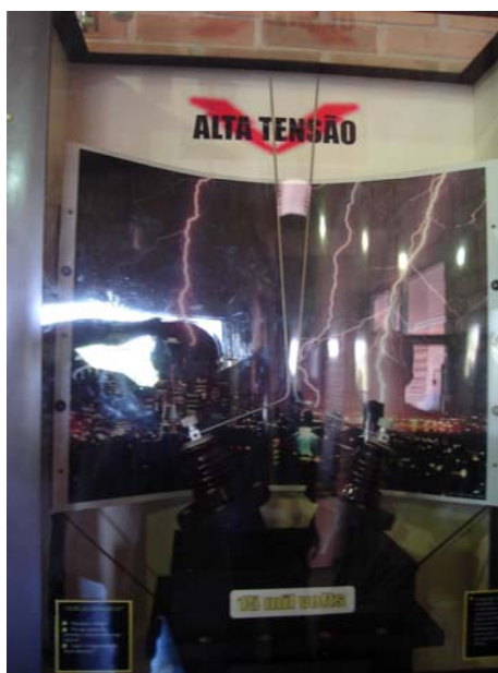
Figura 4 – Faiscador de chifre

- Faiscador de chifre (figura 4): equipamento constituído de duas hastes metálicas, onde se aplica uma diferença de potencial com alta tensão. Devido à ionização do ar ocorre a descarga elétrica entre os eletrodos. Em consequência do aquecimento do ar, a descarga sobe e percorre as hastes metálicas até o limite de condução por ionização do ar.