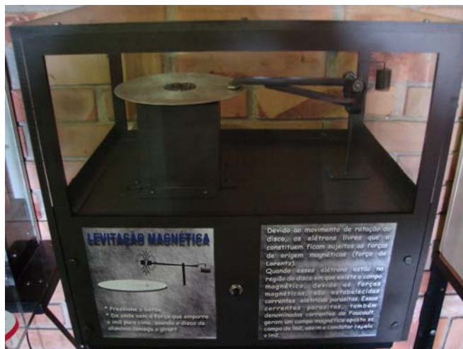
Figura 3 – Equipamento de levitação magnética

magnético são estabelecidas “correntes elétricas parasitas”, ou conhecidas como “Correntes de Foucault”. As correntes parasitas geram um campo magnético oposto ao campo do ímã, então o condutor repele o ímã, o que faz com que a haste levante.