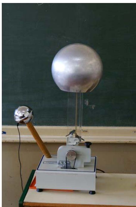
Figura 7 – Gerador de Van de Graaff

- Gerador de Van de Graaff (figura 7): equipamento que explora o uso da eletrostática. Um motor gira dois roletes que estão ligados entre si por uma correia de borracha. Pelo fato da correia estar em contato com algumas escovas de metal, o movimento faz com que a mesma fique eletrizada e atraia cargas opostas para a sua superfície externa. A correia, por sua vez, transporta essas cargas para uma cúpula situada na parte superior do equipamento. A cúpula faz com que a carga elétrica, que se localiza no exterior dela, não gere campo elétrico sobre o rolete superior; Assim cargas continuam a ser extraídas da correia como se estivessem indo para terra, e tensões muito altas são facilmente alcançadas. Quando algum visitante coloca as mãos sobre a cúpula, devido ao efeito de pontas, o cabelo fica eletrizado com cargas de mesma polaridade e, conseqüentemente, se repelem produzindo o efeito de arrepio.