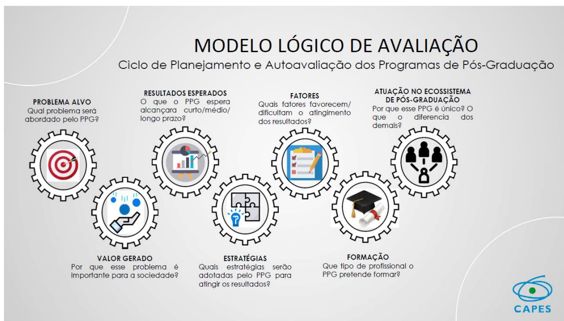
Figura 2 - Planejamento e autoavaliação dos Programas de Pós-Graduação.

O Programa deve analisar e planejar o seu desenvolvimento de forma que as ações e metas sejam claras a todos os participantes, para isso a discussão coletiva desse projeto deve acontecer para que todos sejam corresponsáveis pela qualidade e melhoria do Programa. Há a necessidade que todos devam trabalhar para que o Programa continue a evoluir como um ecossistema (figura 2), onde os estudantes, docentes, técnicos e egressos, participem como elementos do desenvolvimento do Programa e da instituição.