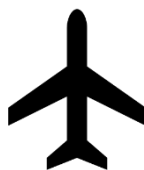
Figura 1 – Nome da figura

Figuras, quadros, gráficos, fotografias entre outros, devem ter seu título grafado acima destes e sua fonte logo abaixo. A indicação da fonte deve ser grafada com fonte menor que a do texto.